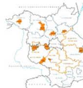
Gründungsmitglieder der Arbeitsgemeinschaft Fahrradfreundliche Kommunen Brandenburg (AGFK BB)

Gern stehen wir Ihnen bei Fragen zur Verfügung.